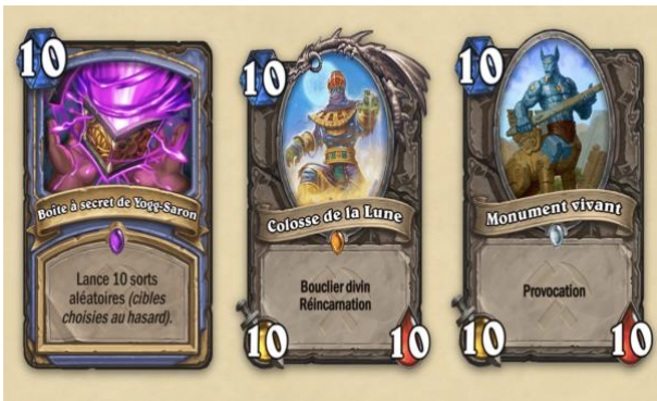
Capture d'écran 4: HearthStone – Extension 2019 « Les Aventuriers d'Uldum » (Blizzard Entertainment)

Exemple : Une autre stratégie qui vise à inciter les consommateurs à faire des achats intégrés est la méthode dite du «Pay or Wait». Il s'agit ici, selon Labelle et Boucher [17, p. 81] d'accorder une valeur hors prix au temps. Le principe est simple : Suite à un échec, le consommateur devra attendre un certain temps avant de pouvoir tenter sa chance de nouveau, à moins bien sûr de payer pour avoir l'occasion d'essayer de nouveau.