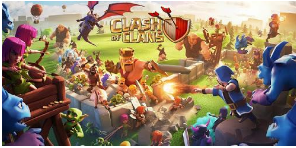
Capture d'écran 2: Bannière de Clash of Clans (Supercell)

Exemple : Clash of Clans est un jeu de stratégie en ligne massivement multijoueur (MMO) de stratégie en temps réel. Dans de tels jeux, les investissements faits par les coéquipiers mettent de la pression à dépenser davantage, en vue d'égaliser ou de dépasser leurs investissements.