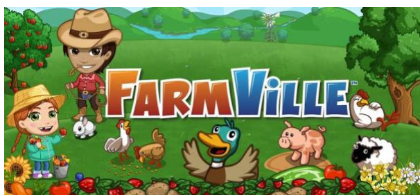
Capture d'écran 1: Bannière de FarmVille (Zynga)

Exemple : FarmVille, un des plus grands succès de ces jeux dits sociaux, est l'exemple type d'un modèle de monétisation basé sur les interactions sociales. Dans ce jeu [16], contacter d'autres joueurs vous permet d'améliorer votre ferme plus rapidement, en utilisant leur aide comme ouvriers agricoles ou en gagnant des récompenses en les aidant. À défaut de tels contacts, le joueur peut bien