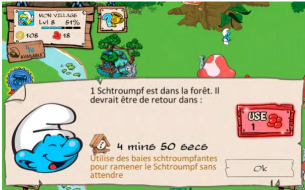
Capture d'écran 3: The Smurfs (IPMS)

Exemple : Clash of Clans est un jeu de stratégie en ligne massivement multijoueur (MMO) de stratégie en temps réel. Dans de tels jeux, les investissements faits par les coéquipiers mettent de la pression à dépenser davantage, en vue d'égaliser ou de dépasser leurs investissements.