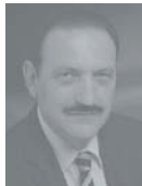
Beat W. Zemp, Président de l'Association faitière des enseignants suisses (LCH)

La toxicomanie est une problématique complexe qui nécessite des réponses plurielles et adaptées. La politique des quatre piliers permet la mise en oeuvre de ces mesures diversifiées. C'est une politique pragmatique et efficace. Soutenons-la et rejetons les propositions obscurantistes qui dénie aux toxicomanes le droit d'exister et de se soigner dans la dignité et le respect des droits humains.