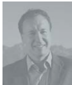
Pierre-Yves Maillard, Conseiller d'Etat Vaud

L'approche des addictions a passé du « jugement moral » exigeant l'abstinence immédiate par un sevrage rapide, à tout prix, à l'approche scientifique, bio psychosociale, au « jugement clinique ». La politique des 4 piliers a été le berceau de ce changement et l'a grandement favorisé : y renoncer impliquerait un retour en arrière mortifère et dommageable pour la population.