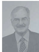
Dr. Marcel Guignard, Président de l'Union des villes suisses

La prévention figure en bonne place dans la révision de la Loi sur les Stupéfiants. C'est pour moi un instrument essentiel d'une politique dynamique dans le domaine des toxicomanies.