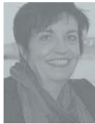
Maria Roth-Bernasconi, Conseillère nationale

Je vote oui à la LStup parce que cela fait près de 15 ans que je travaille auprès de personnes toxicodépendantes et que je sais que les mesures mises en place grâce à la politique des 4 piliers sont efficaces. Beaucoup d'entre eux s'en sont sortis. La réduction des risques a permis à de nombreux usagers de drogues de rester en vie dignement et d'avoir l'opportunité d'en sortir. Il faut être vivant pour décider d'entamer une démarche vers l'abstinence.