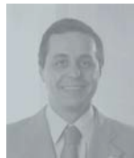
Ignazio Cassis, Conseiller national PRD, Président SANTE PUBLIQUE SUISSE

Je soutiens la modification de la Loi fédérale sur les stupéfiants parce qu'elle pérennise une politique de la drogue qui a fait ses preuves depuis 10 ans et qu'elle consolide les quatre piliers de l'intervention de l'Etat: la répression, la prévention, le traitement et la réduction des risques.